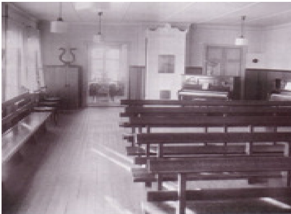
Samlingslokalen på översta våningen.